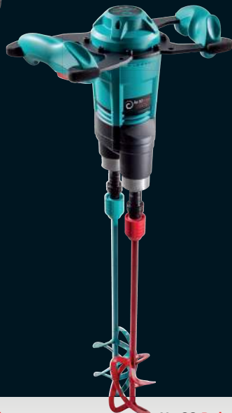
Xo 33 R duo