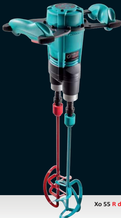
Xo 55 R duo