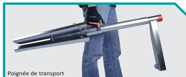
Poignée de transport