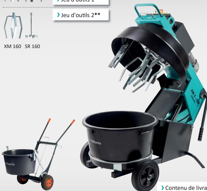
XM 160 SR 160