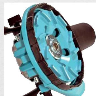
Anneau à lamelles fermé pour des travaux générant peu de poussière*