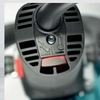
Protection anti-surchauffe par contrôle visuel