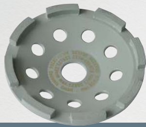
UST 125 Universal