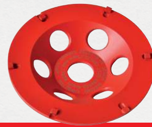
PST 125 Strap-it