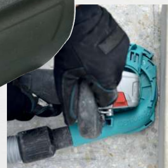
Ouverture pratique du segment pour des travaux le long des plinthes