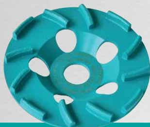
BST 125 Cyclon

pour la ponceuse à béton CMG 1700 (Ø 125 mm)