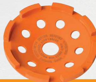
GST 125 Grinder