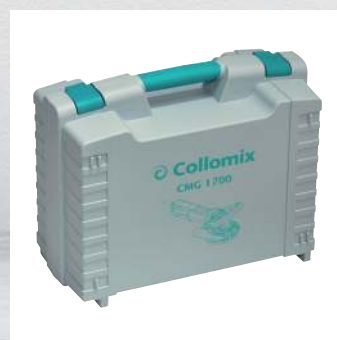
Coffret solide pour stockage sûr et pratique